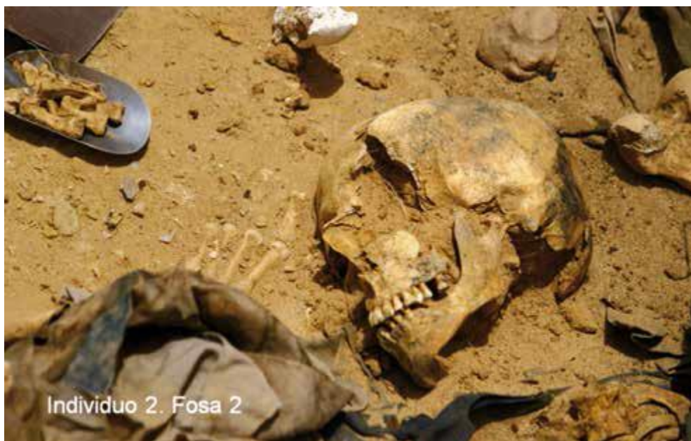
Cráneo fracturado en la región orbitaria izquierda por penetración de proyectil de arma de fuego