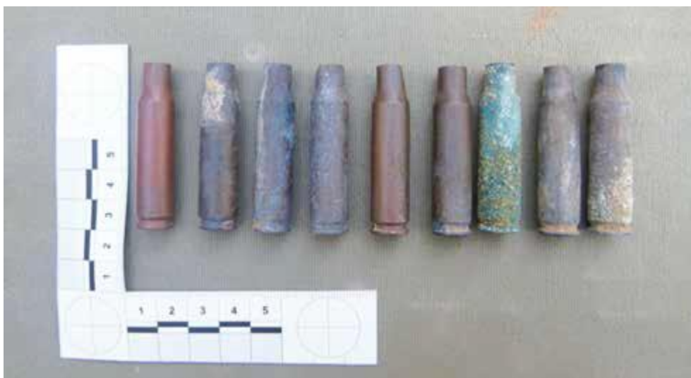
Casquillos de fusil calibre 7,62 con marcajes de los años 1963 y 1964