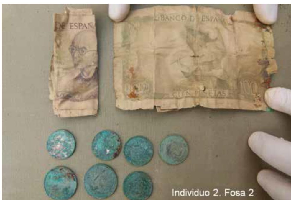
Documentación y Dinero: billetes de 100 pesetas, monedas de 25 y 5 pesetas